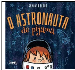
O Astronauta de Pijama Autora: Samanta Flôor Editora Jupati Books